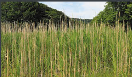
Pappmühle – Hess. Oldendorf | Modell: Lara