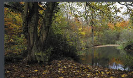
Nesselberg – Brunnighausen | Modell: Lena