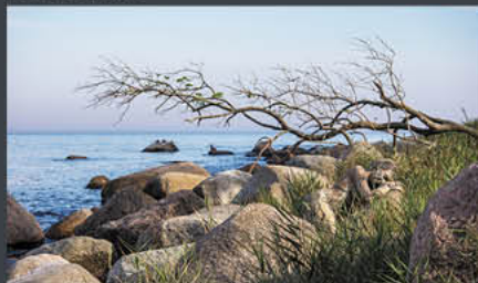
Staberhuk – Fehmarn | Modell: Darky