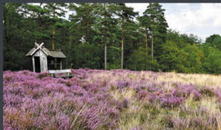
Lüneburger Heide | Modell: Katey