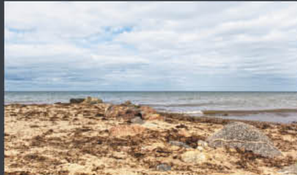
Behrendorf – Ostsee | Modell: Katey