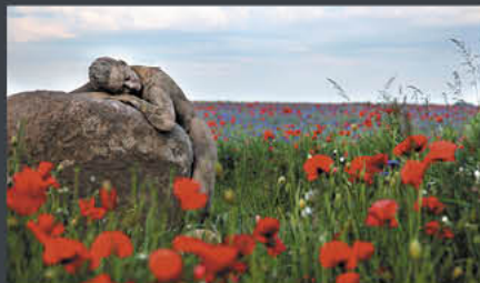
Fliegerhorst – Wunstorf | Modell: Lea