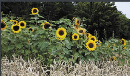
Behrens – Coppenbrügge | Modell: Darky