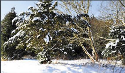
Süntel – Unsen | Modell: Randy