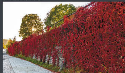
Weserpromenade – Hoxter | Modell: Christina | Foto: A. Große-Strangmann