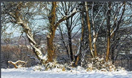
Solling – Neuhaus | Modell: Randy